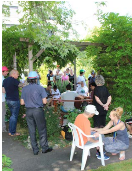
Journée surdicécité : un bon moment convivial sous la tonnelle!