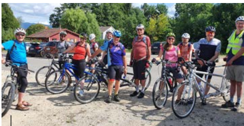
Toutes ces activités durant le séjour d'été à Vaumarcus grâce aux donateurs...