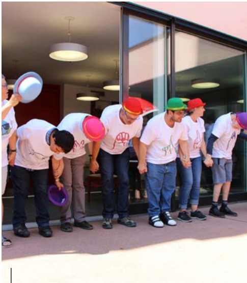
Les acteurs saluent leur public constitué des seuls résidents des Marmettes durant cette journée de la surdicécité fermée au public.