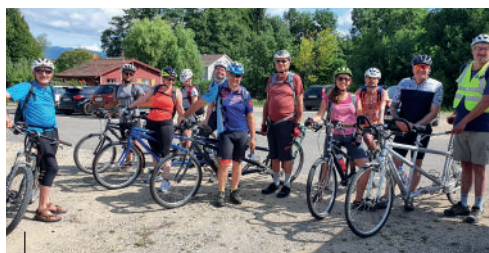
Toutes ces activités durant le séjour d'été à Vaumarcus grâce aux donateurs...