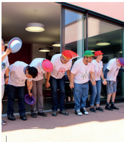
Les acteurs saluent leur public constitué des seuls résidents des Marmettes durant cette journée de la surdicécité fermée au public.