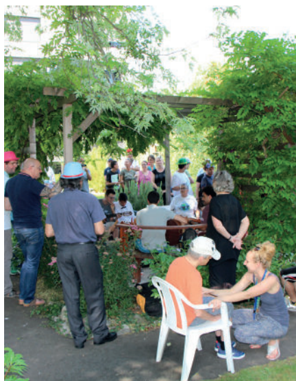
Journée surdicécité : un bon moment convivial sous la tonnelle!