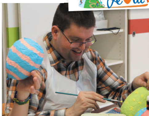
Les Activités du Jeudi sont très prisées et sources de joie.