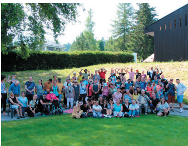
Grâce à vous, chère donatrice et cher donateur, un grand groupe avec une nuée de sourires !