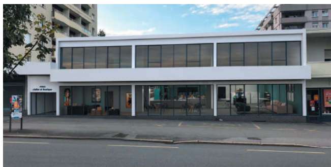
La façade et la vitrine des nouveaux ateliers au centre-ville de Monthey.

Vinciane, responsable des ateliers a dressé un bilan.